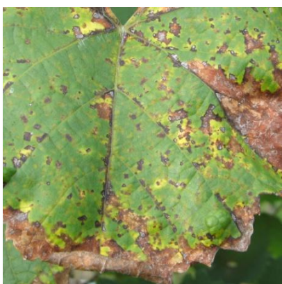
Peronospora a mosaico