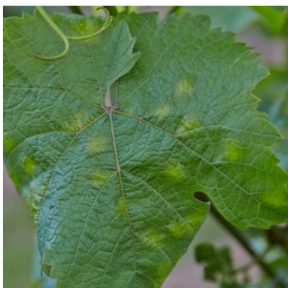
Macchie su pag. superiore

Dopo la fase di allegagione, attacchi di questo parassita originano la sindrome conosciuta come peronospora larvata , che rimane insediata all'interno degli acini, determinando colorazione bruna e avvizzimento dei frutti.