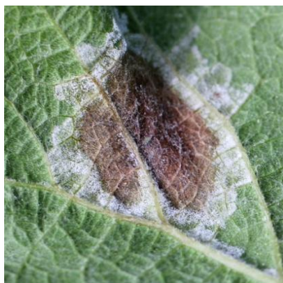
Macchia sporulata, pag. superiore