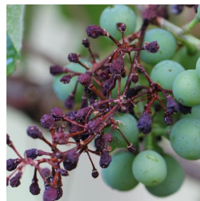
Grappolo con Peronospora larvata