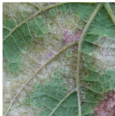
Macchie sporulate, pag. inferiore