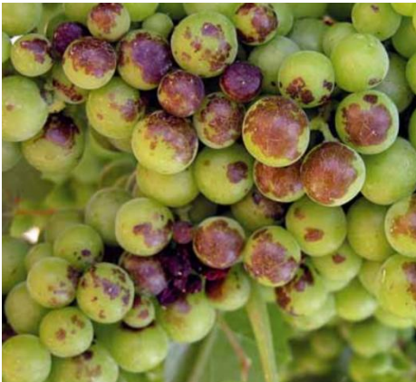
Danni da scottature solari