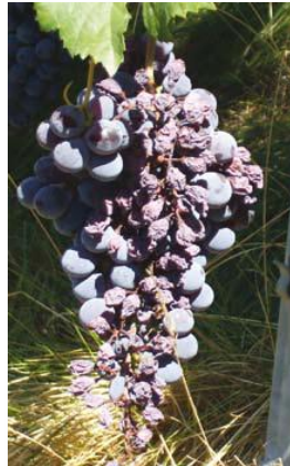
Danni da scottature solari