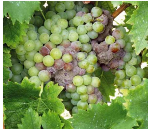
Microclima umido e patogeni fungini