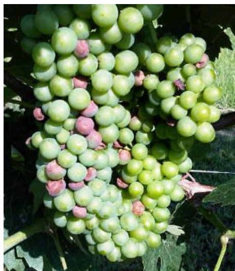
Grappoli con sintomi di black rot