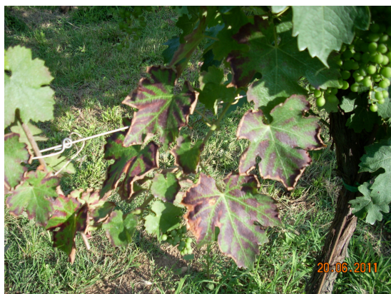
Esito di attacchi di peronospora in vigneto abbandonato a San Giovanni di Bigolino